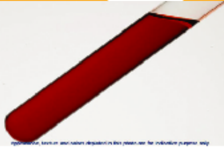
Optimization, based on associated regulations in this place, use for industrial purposes only